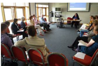
Multiplier Event in London

Die britische Netzwerkveranstaltung für ComProCom wurde durch SLD organisiert und fand am 06.05.2016 in London statt. Den Teilnehmern wurde das intellektuelle Output „Übersicht über die gegenwärtige Situation“ präsentiert, der methodische Ansatz von ComProCom sowie der publizierte Artikel.