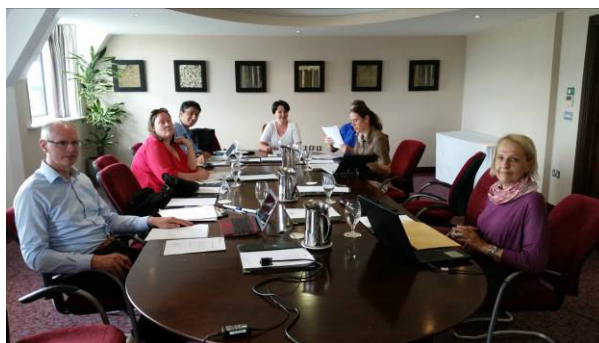
Partnerschaftstreffen in Clane