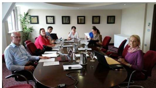
Συνάντηση Εταιρικού Σχήματος στο Clane (Ιρλανδία)