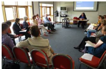
Εκδήλωση Ανακοίνωσης στο Λονδίνο, 2016

Η πρώτη πολλαπλασιαστική εκδήλωση του ComProCom πραγματοποιήθηκε στις 6 Μαΐου 2016 στο Λονδίνο από τον Βρετανό εταίρο SLD. Στους συμμετέχοντες παρουσιάστηκαν τα αποτελέσματα της Συγκριτικής Έκθεσης της Υφιστάμενης Κατάστασης, η μεθοδολογική προσέγγιση του ComProCom, καθώς και τα βασικά προϊόντα, τα οποία θα παραχθούν στο πλαίσιο του έργου. Τρεις από τους συμμετέχοντες έκαναν, επίσης, σύντομες τοποθετήσεις σχετικά με τις σχετικές με το αντικείμενο του έργου, εξελίξεις στο Ηνωμένο Βασίλειο. Οι παρουσιάσεις της εκδήλωσης έχουν αναρτηθεί στην ιστοσελίδα του έργου, καθώς και στην ιστοσελίδα: http://devmts.org.uk/sl.pdf .