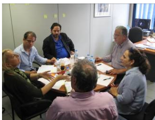
ΗΕΕΤΑΑ παρουσιάζει το Σχέδιό της στην Εθνική Ομάδα Στήριξης